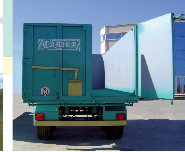
Apertura de 2 hojas sin travesaño Opening for the 2-leaf door with absent crossbar. Ouverture de 2 vantaux sans traverses