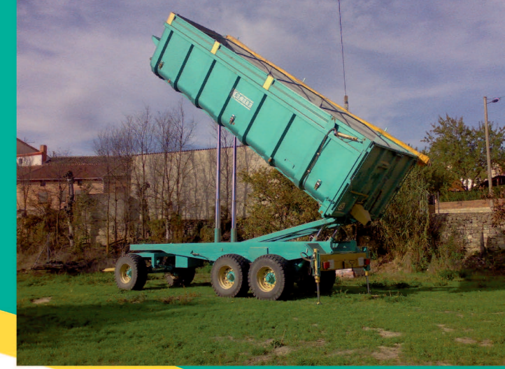
Remolque elevatiz Lift agricultural trailer Remorques élévtriques