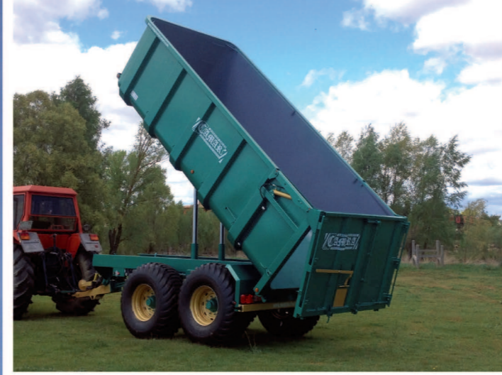
Puerta hidráulica y automática Door with double opening feature: hydraulic and automatic. Porte hydraulique et automatique