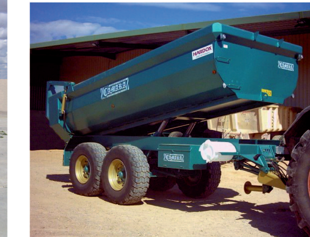
Fabricación en HARDOX Manufacture in HARDOX Fabrication en HARDOX