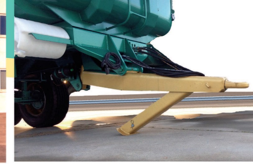
Suspensión hidráulica en lanza y apoyo tipo tijera Scissor type hydraulic drawbar. Flèche à suspension hydraulique réglable en hauteur avec béquille hydraulique type ciseaux