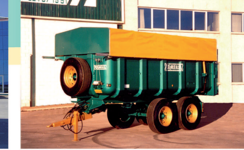
Lona de fuelles Bellows canvas Bâche.