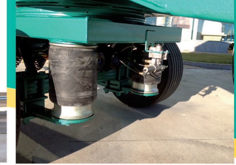
Suspensión y frenos neumáticos Pneumatic suspension system and pneumatic brakes Suspension et frein pneumatique